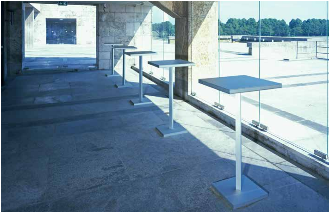
■ Freistehende Informationsstele