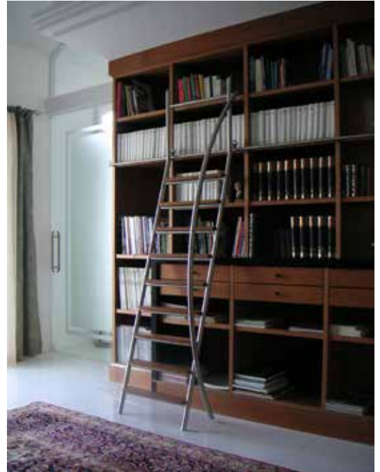
■ Mobile Edelstahlleiter in Führung für Bibliothek