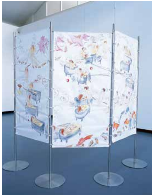
■ Paravent aus Edelstahl