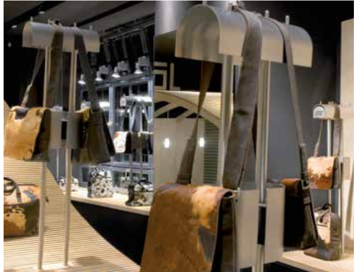
■ Jost-Store Berlin

Die Marke JOST steht für eine unkonventionelle hochwertige Taschenmode. JOST-Taschen begleiten ihre Frau und ihren Mann selbstbewusst und charak­tervoll in allen Lebenslagen, ob in Beruf, Alltag oder Freizeit. Der urbane Zeitgeist und das einzigartige Design spiegeln sich auch in der individuellen Gestaltung der JOST-Stores wider. So werden zum Beispiel die originellen Edelstahl-„Puppen“ für die kunstvolle Präsentation der JOST-Taschen von uns maßgefertigt.