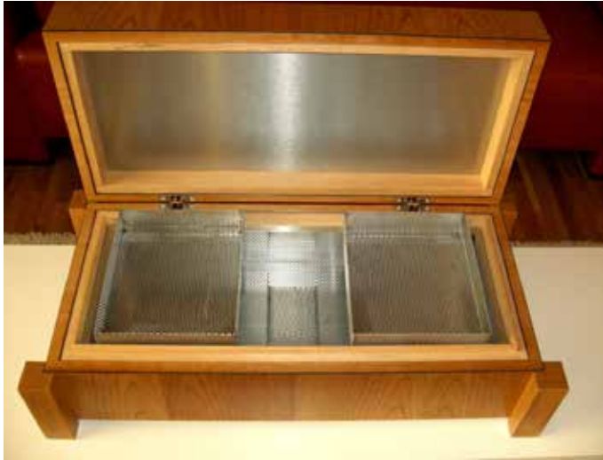
■ Humidor Kombination aus Holz-Edelstahl (Lochblech)