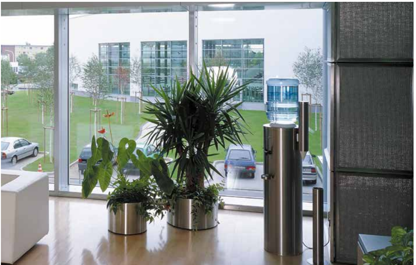
■ Opel Rüsselheim Blumenkübel und Wandverkleidung