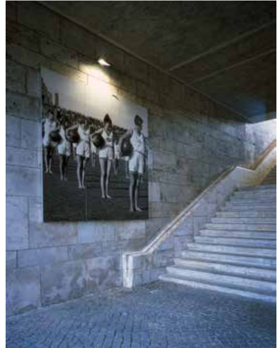
■ Alu-Paneel mit aufgeklebter Bildfolie und Möbel aus anodisiertem Aluminiumblech

Das Deutsche Historische Museum betreibt hier heute eine Ausstellung zur Geschichte des Olympia-Geländes. Wir lieferten für die Ausstellung speziell angefertigte Präsentationsstelen, auf denen in Schrift, Bild und auf Monitoren über die wechselvolle Geschichte der Anlage informiert wird. Darüber hinaus stammen auch die dazu passenden Bänke, Hocker und Stehtische von uns.