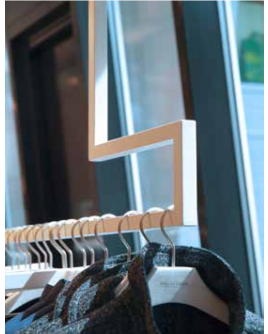
■ BAILLY-DIEHL Showroom Mainz

BAILLY-DIEHL überzeugt als Modemarke mit Klasse und Charakter. Der Kunde steht im Mittelpunkt allen Handelns. Kundenzufriedenheit, Service und Qualität sind somit bei BAILLY-DIEHL oberstes Gebot. Die Kollektionen sind trendbewusst und hochwertig verarbeitet, und das zu fairen Preisen. Entsprechend offen, klar und freundlich sind auch die Showrooms von BAILLY-DIEHL gestaltet.