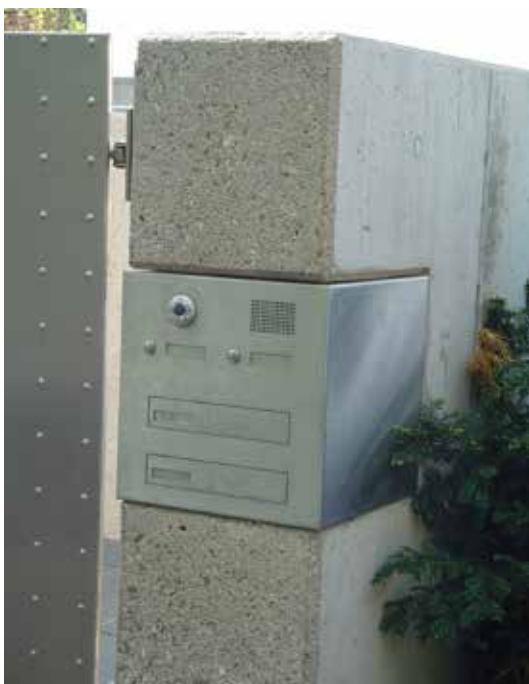
■ Möbel und Kunst für Objekt und Privat