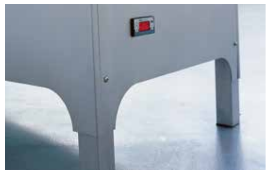
■ Schokowanne aus Edelstahl