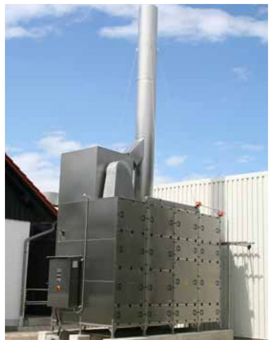
■ Kläranlage Moosburg