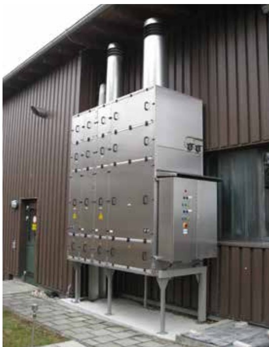
■ Kläranlage Fürstenfeldbruck