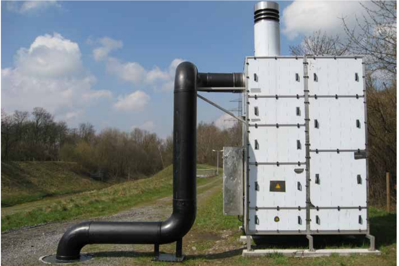
■ Kläranlage Emscher BS40